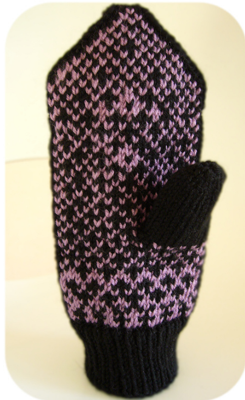
Vue de la paume